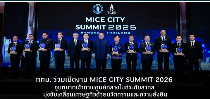
กทม. ร่วมเปิดงาน MICE CITY SUMMIT 2026 ชุดบทบาทเจ้าภาพศูนย์กลางไมซ์ระดับสากล มุ่งขับเคลื่อนเศรษฐกิจด้วยนวัตกรรมและความยั่งยืน

กทม. ร่วมเปิดงาน MICE City Summit 2026 ชุดบทบาทเจ้าภาพศูนย์กลางไมซ์ระดับสากล มุ่งขับเคลื่อนเศรษฐกิจด้วยนวัตกรรมและความยั่งยืน